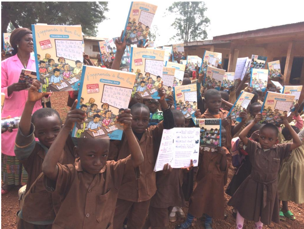
Glada skolbarn med skolböcker i Kamerun

De insamlade medlen är ju till för att användas till och glädjande var att vi kunde bevilja 16 ansökningar från Rotaryklubbar i Sundsvall i norr till Ystad i söder. 349 750 kronor delades ut, vilket var i samma nivå som föregående år. Av dessa gick 78 2500 kronor till fem klubbar i vårt distrikt, nämligen Lund-Ideon för IT-utbildning för unga kvinnor i Tanzania, Helsingborg-Kärnan för tandvård i Rumänien, Skurup och Ystad-Tornväktaren för utbildning av kvinnor i Kenya samt Malmö-Skeppsbron för tandläkarutrustning i Brasilien.